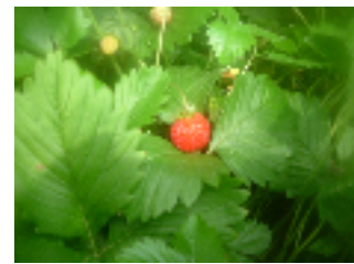
ハーブ園の“ワイルドストロベリー”