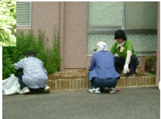
花壇の草抜きの様子